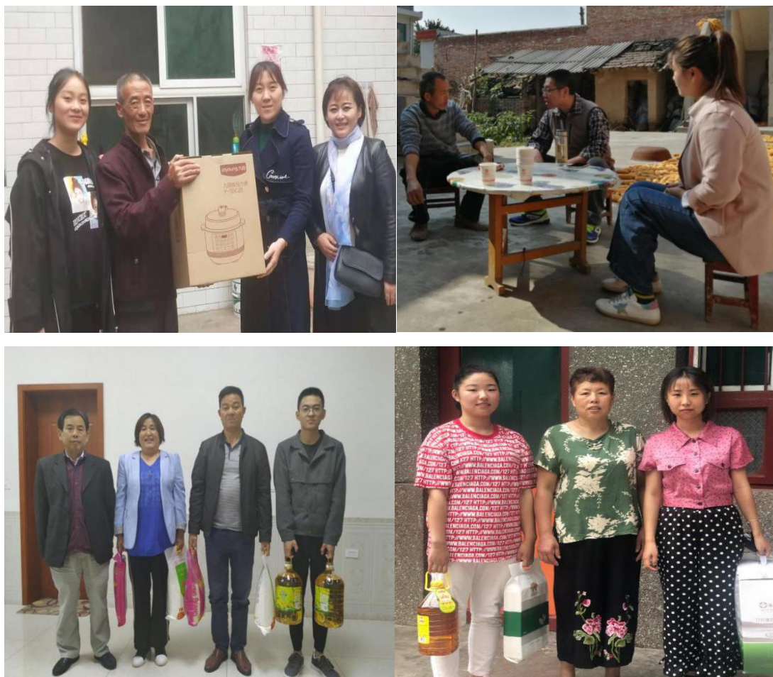
图 4.3 学院开展 2019 年“精准资助基层行”走访活动