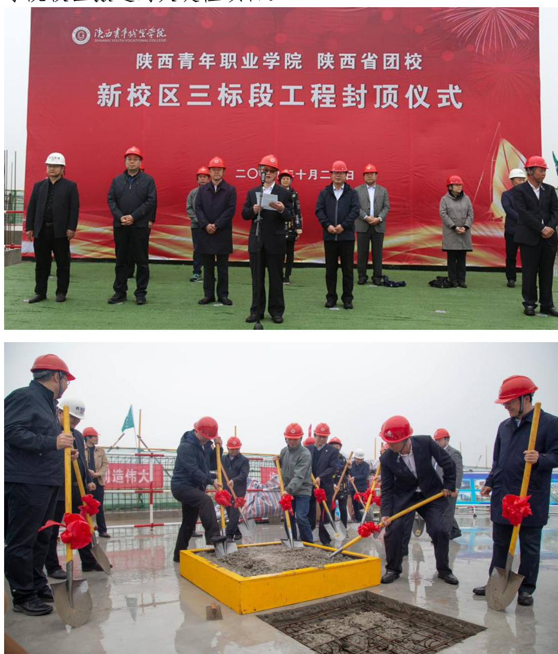
图 6.3 学院新校区三标段工程主体封顶

10月20日学院举行三标段工程主体封顶仪式，团省委书记、党组书记段小龙与建设和施工单位进行了座谈，并深入到宿舍、厨房，慰问了建设单位的职工。随后向建设单位代表颁发了慰问品，并共同挥锹填土，见证封顶时刻。三标段工程是解决和改善学院办学条件的基础工程，也是关系到学院校区搬迁的关键性项目。