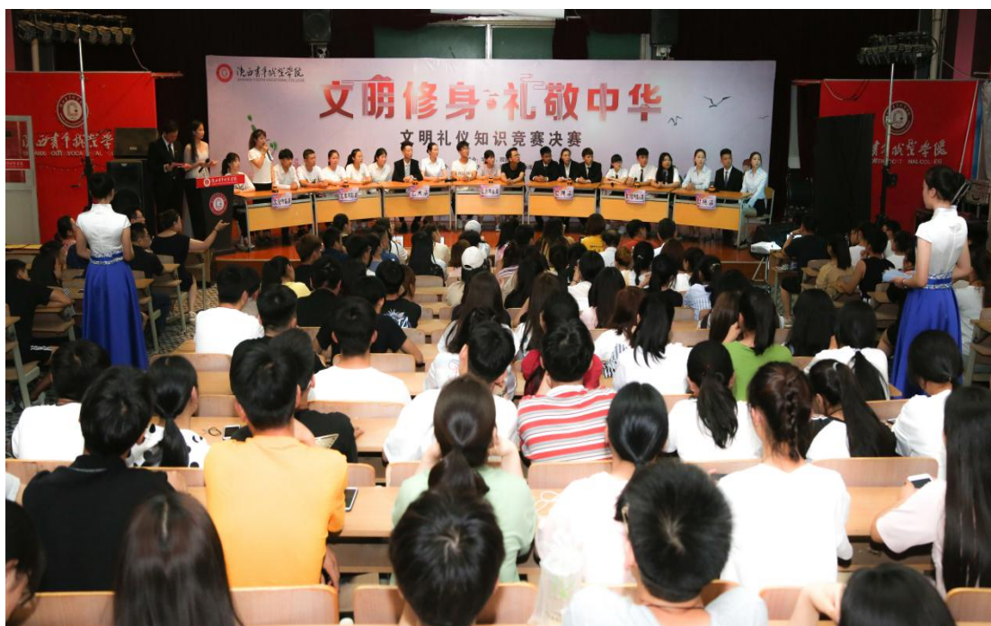
图2.1 学院举办“文明修身、礼敬中华”礼仪知识竞赛