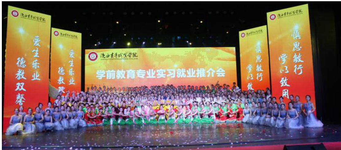
图 3.2 学前教育专业举行 2019 年实习就业推介会