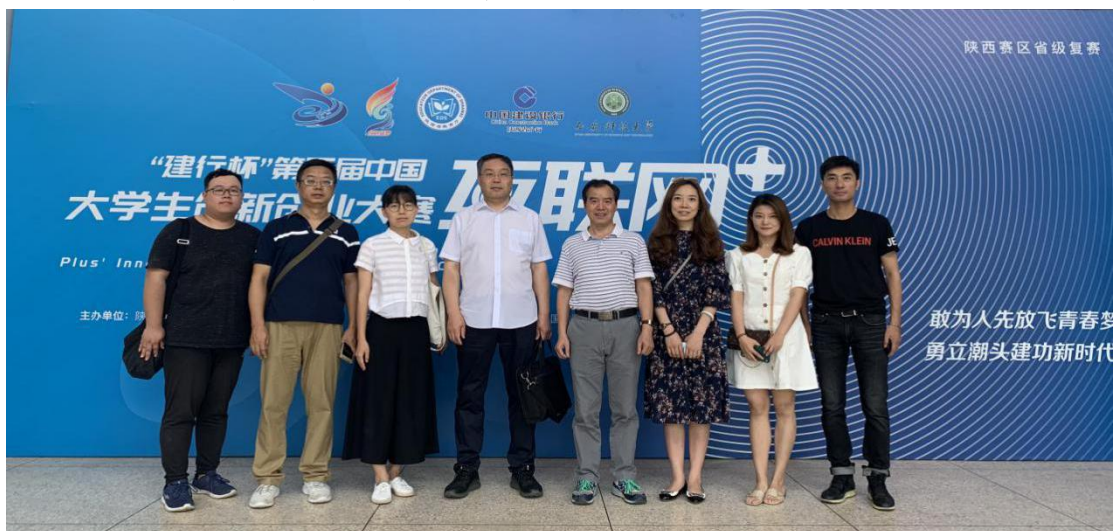
图 3.3 “青轻营”工作室参加第五届大学生创新创业大赛

为了凸显创业的技术性、实用性以及与专业的契合度，财经系、市场营销专业试点开展了专创融合，并在此基础上由专业老师指导，学生自发创建的“青轻营”工作室，2018 年 11 月 11 日创办同名公众号。成立一年多来，该公众号已经成为传播商业知识、挖掘营销话题的专业微信公众平台。截止目前为止，粉丝过千，累计发布文章上百篇，该运营号的成功，也使得该项目获得了陕西省创新创业大赛铜奖。