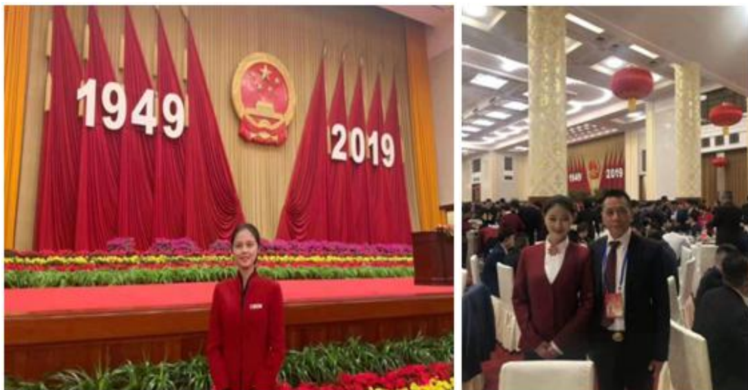
图 4.1 学院学生在北京人民大会堂参与大庆会务及宴会服务

满地完成了各项交付的工作任务，受到有关单位的一致好评，实现了学院培养高素质技术技能人才的培养目标。