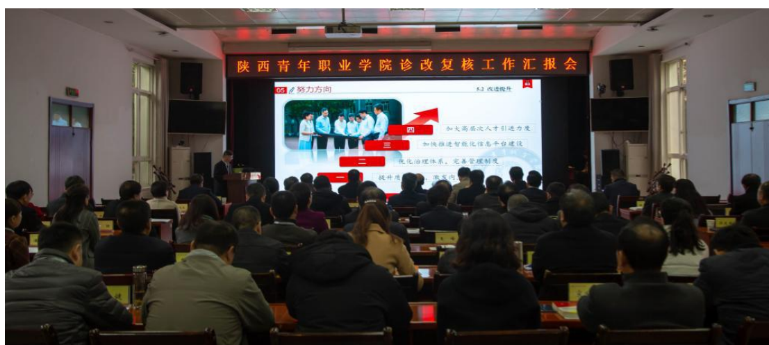
图 6.1 学院诊改复核工作汇报会

审阅资料的基础上，进校现场复核，通过数据分析、状态考察、面上调查、深入研讨、取样分析、多维建构等多种形式，听取了学校诊改整体情况、专业、课程、教师、学生层面的诊改汇报，召开了 15 场座谈会，深度访谈了校领导、职能部门负责人、系部负责人、专业带头人、课程负责人、骨干教师、实习指导教师、辅导员、班主任、相关部门工作人员、学生代表等 163 人次，全面考察学校“两链”打造、“螺旋”运行、质量文化建设、信息化建设与运行等情况。