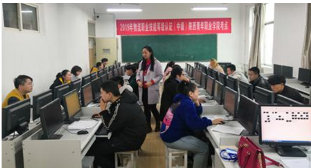
图 3.1 学院举行 2019 年物流职业技能等级认证考试