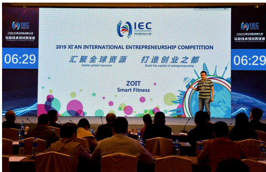
图5.2 管理系组织师生观摩“2019年西安国际创业大赛”