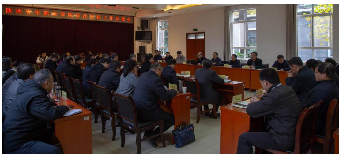
图 6.2 学院诊改复核工作反馈会