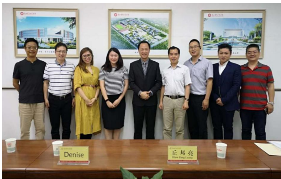
图5.1 马来西亚伯乐大学来我院访问交流