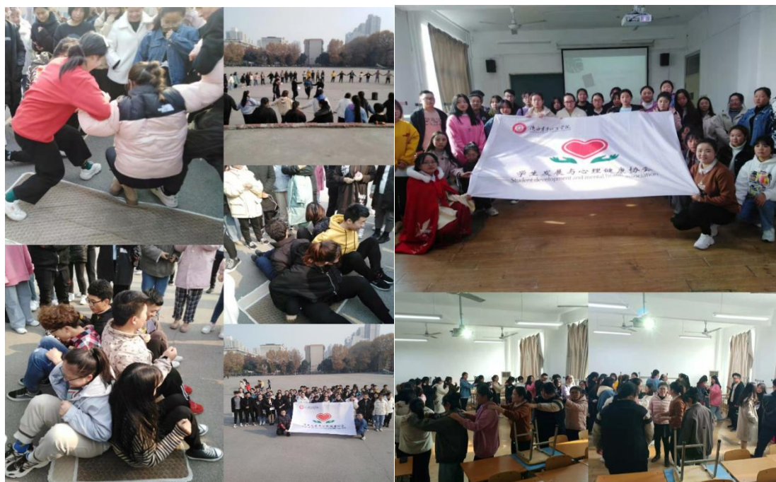
图2.4 大学生朋辈心理帮扶队伍组织开展团体辅导

学院将大学生心理健康教育作为新形势下加强大学生思想政治工作、促进大学生全面发展的重要内容。老师指导与学生自我教育相结合的新模式，可以充分调动广大学生的积极性和主动性，增强大学生自我心理调适能力，是开展大学生心理健康教育的有效途径。从2015年起，学院在每个班级设立班级心理委员、宿舍心理联络员为班级同学、寝室同学及身边朋友提供有关心理健康方面帮助的人，同时于2016年成立了大学生发展与心理协会，建构了大学生心理朋辈帮扶队伍。在每年心理健康工作开展的过程中，这支队伍发挥了朋辈帮扶效果，组织开展了举办“女生节”活动、心理知识科普理心教室、读经典理心教室、入宿舍送暖心、心理标语悬挂和知识展板、给毕业时一封信、心理朋辈加油站、团体心理辅导等各种有益于大学生身心健康的文体娱乐活动和心理团体辅导活动，积极营造积极向上的校园氛围，引导学生全面发展，健康成长。