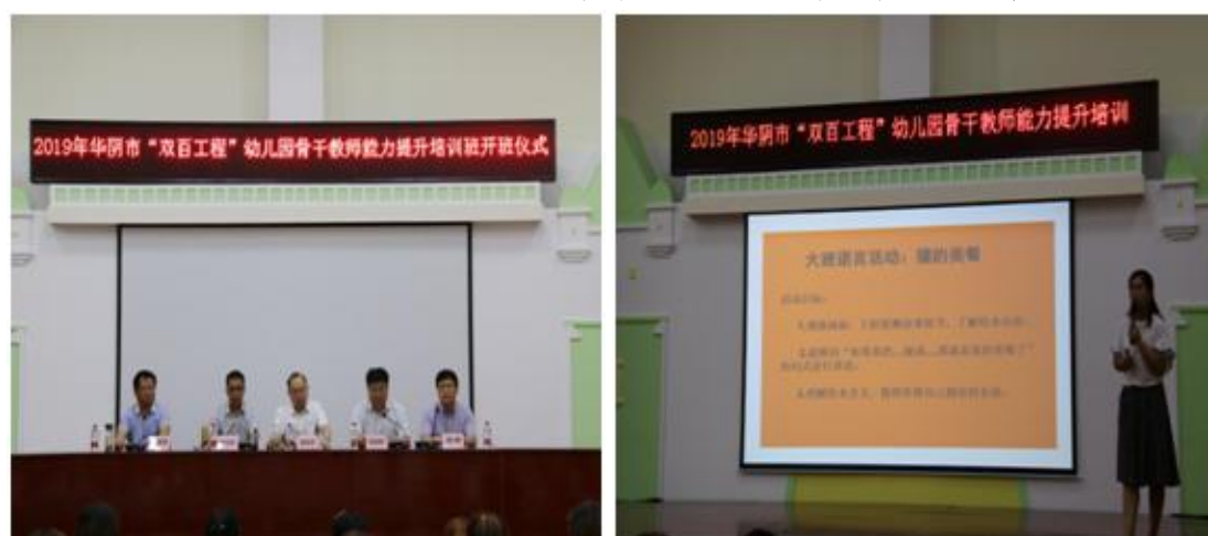
图 4.2 学院举办华阴市“双百工程”幼儿园骨干教师能力提升培训班