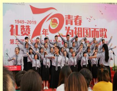
图2.3 学院举行第三届活力团支部风采大赛暨五四表彰典礼