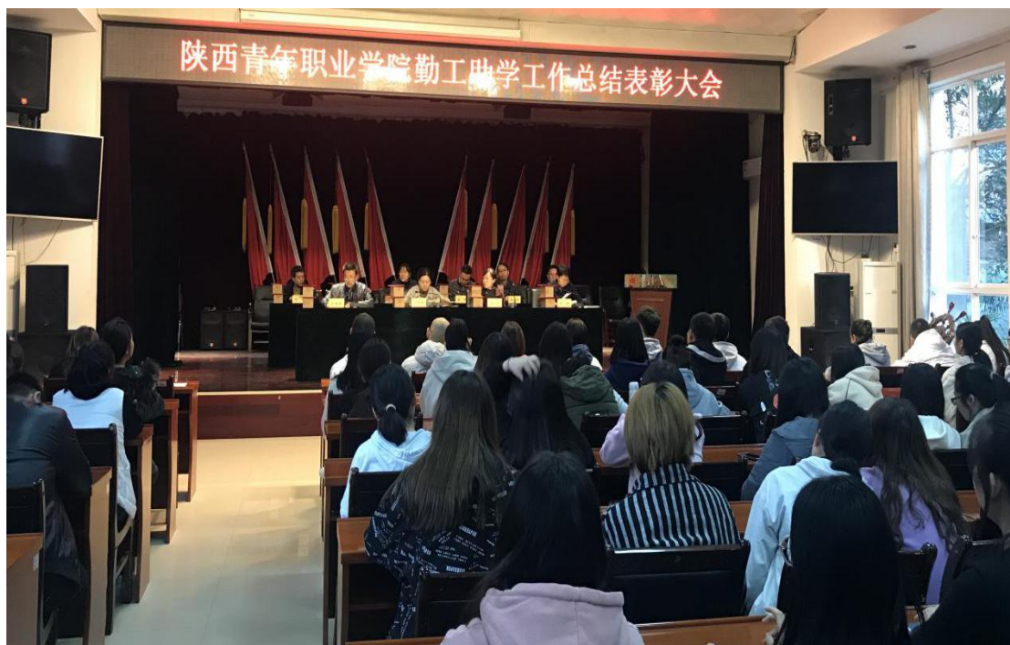
图2.5 学院召开2019年勤工助学工作总结表彰大会

勤工助学活动作为教育与实践紧密结合的一种良好方式，发挥出了“助学”、“育人”的双重功效。本着“以人为本，助教结合”的理念，学院不断优化工作机制，从2004年开始设立勤工助学岗位，最高峰时达到148个，资助学生超过万人次，累计发放工资总计上百万元。图书管理员、机房管理员、辅导员助理等多样化的岗位设置，提高了学生的实践能力，促进了学业提升。通过参与勤工助学工作，学生们用自己的劳动所得，缓解了上学的经济压力，塑造了自强不息、爱岗敬业的优秀品格，充分弘扬了“劳动光荣、技能宝贵、创造伟大”的时代风尚，为学生们最终成功融入社会打下了坚实基础。