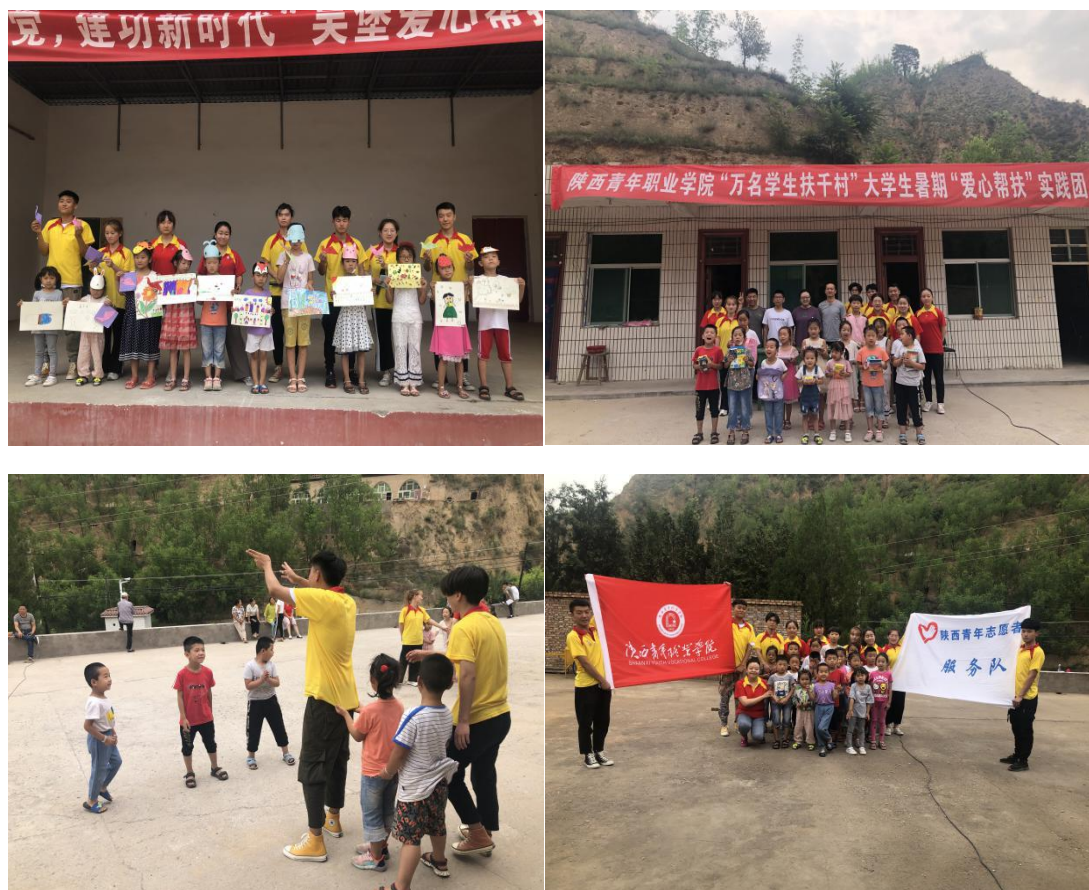
图 4.1 学院志愿者开展暑期志愿帮扶活动助力脱贫攻坚

习成果，加强与孩子的沟通和情感交流。活动期间，帮扶团成员走访慰问了困难学生，为他们送去书包、笔记本等学习用品，勉励他们努力学习，快乐成长。