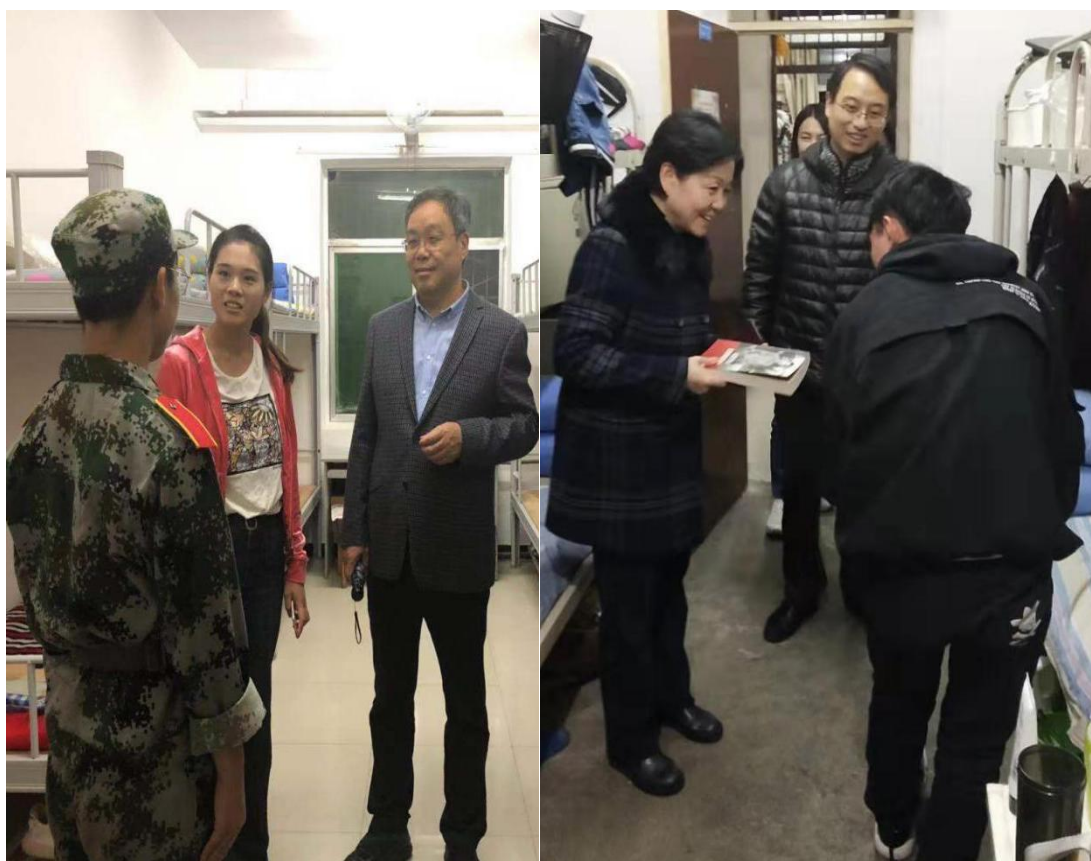
图2.2 学院领导参加每周学生宿舍例检