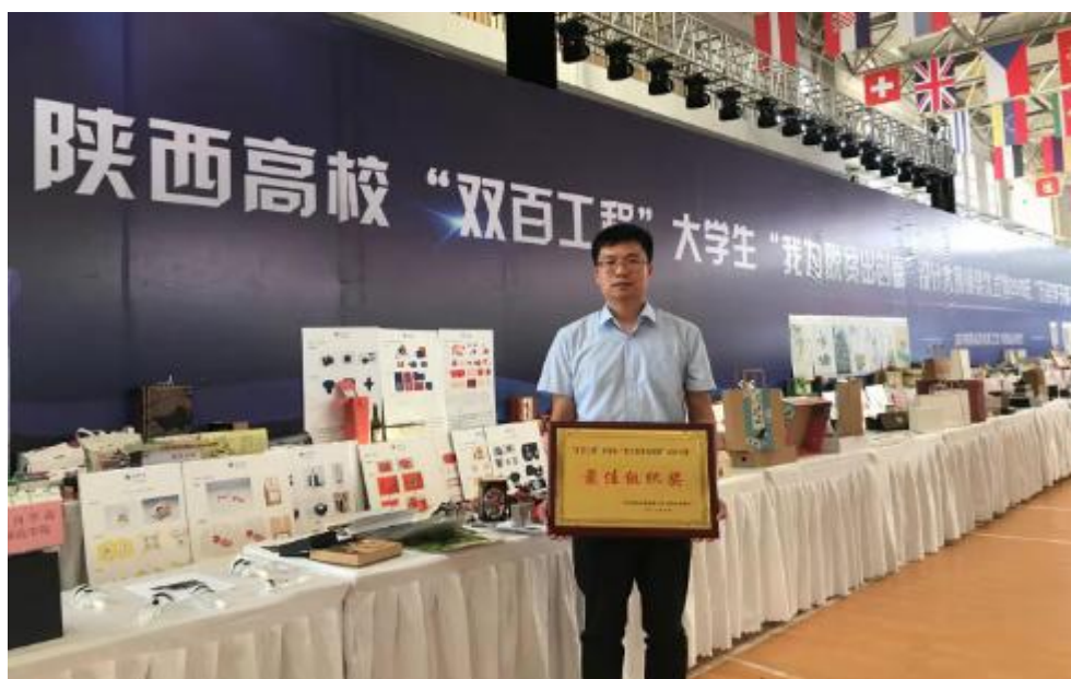
图 3.4 学院荣获省“双百工程”大学生“我为脱贫出创意”设计大赛“最佳组织奖”