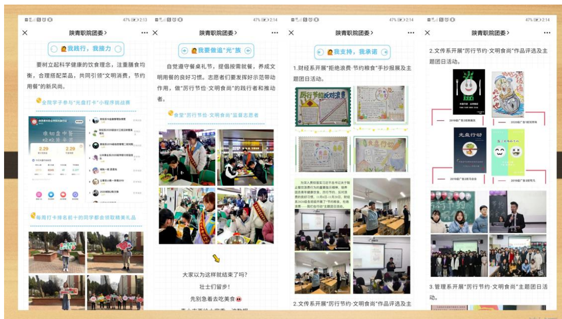
图 2.6 “厉行节约 文明食尚”爱粮节粮主题月活动