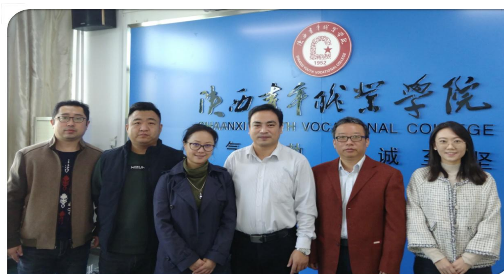
图 5.1 数字信息技术系与日本大阪综合设计专门学校进行合作洽谈

大阪综合设计专门学校是日本上田学园集团旗下的一所子学校，设有动画、漫画、插图设计、角色设计、游戏制作、AR、VR 等课程。双方探讨了各自学校的办学理念 and 治学模式，在作品交流、网格课堂、短期访问、大师讲学等方面达成了一致，并初步约定了更深层次的交流及具体项目的合作。