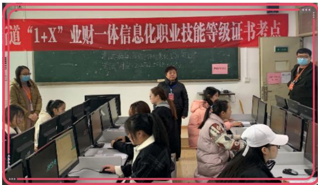
图 3.1 “1+X” 业财一体信息化应用职业技能等级证书考试

根据 “1+X” 证书的要求，会计、财务管理专业将 “1+X” 证书职业技能内容纳入人才培养方案，以选修课的形式放在三、四学期，学生可以根据自己的实际情况进行学习，进一步巩固学习与训练。为了更好的实施 “1+X” 证书项目工作，财经系多次同新道科技股份有限公司进行沟通商榷相关培训事宜，期间多次调研兄弟院校的成熟经验，不断组织教师培训、教研室讨论，合理安排考前培训指导。顺利地完成了会计教研室教师的师资培训和考前的学生培训工作。