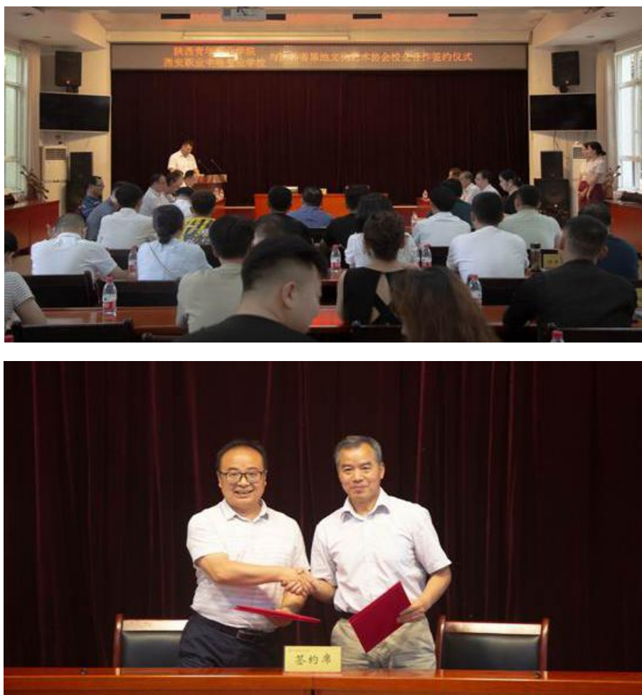
图3.5 学院与陕西省黑池文化艺术协会开展校企合作