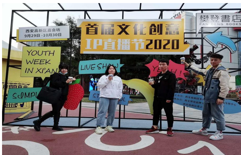
图3.6 创新创业实验班同学参观创业街区