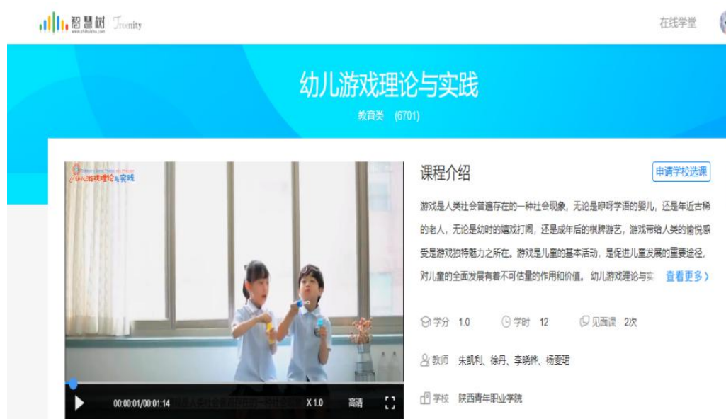
图 3.3 《幼儿游戏理论与实践》课程网站

课程实施方案、电子课件、教学设计、微课、试题库等，已经完全可以满足“线上+线下”的教学。