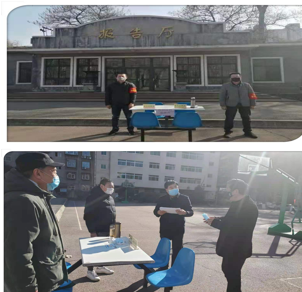
图 4.4 学院在含光校区设置疫情防控党员先锋岗

疾风知劲草，烈火炼真金。在这抗击疫情的关键时刻，疫情防控党员先锋岗的共产党员不畏风险，奋勇向前，带头落实院党委的安排部署，坚决阻断疫情传播，为全院师生构筑起一道守护生命的安全防线，用实际行动践行了入党誓词，诠释了共产党员的初心和使命。