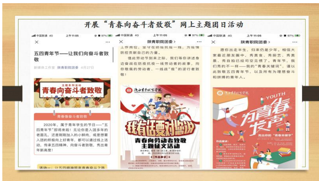
图 2.1 “青春向奋斗者致敬” 网上主题团日活动