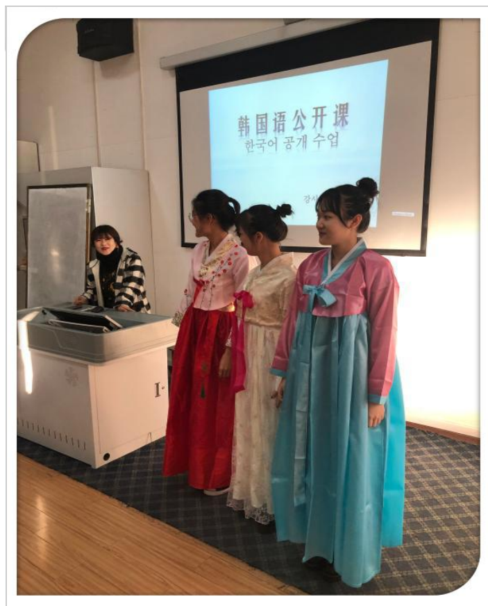
图 5.2 艺术系举办韩国文化公开课活动

12月9日上午，艺术系在含光校区空乘模拟客舱举行韩国文化公开课活动，此次公开课活动由西安外国语大学国际交流合作中心主办。在学院的大力支持下，艺术系通过西安外国语大学国际交流合作中心与韩国又松大学初步建立合作关系，开始推进空乘、高乘专业国际合作交流项目。为了打通国际交流合作的语言障碍，艺术系利用空乘、高乘专业课程体系中已有日韩语选修课程的优势，植入国际合作的语言课程体系，由合作单位提供专业师资进行日常教学，开展文化交流活动。此次公开课活动为学生提供了丰富的语言学习资源，极大地调动了学生参与语言学习的积极性，为顺利推进合作项目奠定了基础。