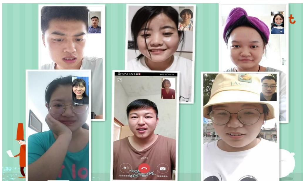
图 2.5 开展网络“知心青苑”工程情况

为做好疫情防控常态化期间学生思想政治教育，学生处出台了《陕西青年职业学院“知心青苑”面对面谈心谈话工作实施办法》，积极统筹开展了学生谈心谈话活动，各系、部高度重视此项工作，召开会议，加强指导，坚持以学生为中心，全面围绕学生、关照学生，更加密切联系学生，帮助学生解决思想问题和实际困难。通过本次谈心谈话活动，一是在学生中厚植了爱国情怀，向学生传递了我国坚持“人民至上、生命至上”抗疫理念，讲述了我国抗疫取得的重大成果，学生们增强了抗击疫情的信心。二是加强了教育教学管理，有效地引导学生上网课期间遵守纪律、严于律己。同时在谈心谈话中有针对性地组织学生参加网上招聘，指导学生参加应征入伍、专升本、西部计划等就业项目，帮助学生纾解就业困难。三是使辅导员、班主任们更加站稳了人民立场、巩固了人民情怀，思想政治素质得到了提高，达到了教学相长的效果，为后续开展网络思政教育、助力学院改革发展奠定了良好基础。