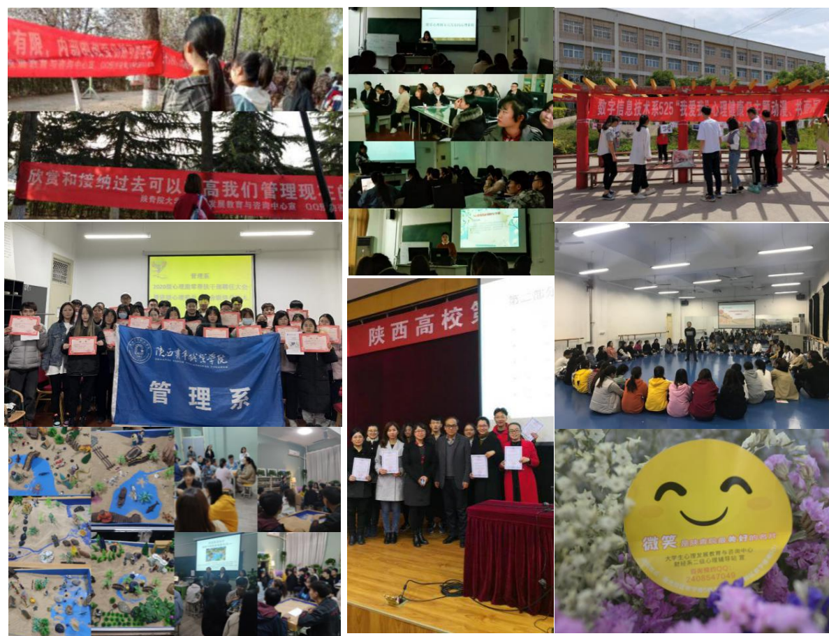
图 2.2 各系分别开展学生心理健康活动

五年制高职部根据学生年龄经常性组织家校联动活动，给学生心理健康发展给与积极的支持和有效的陪伴。