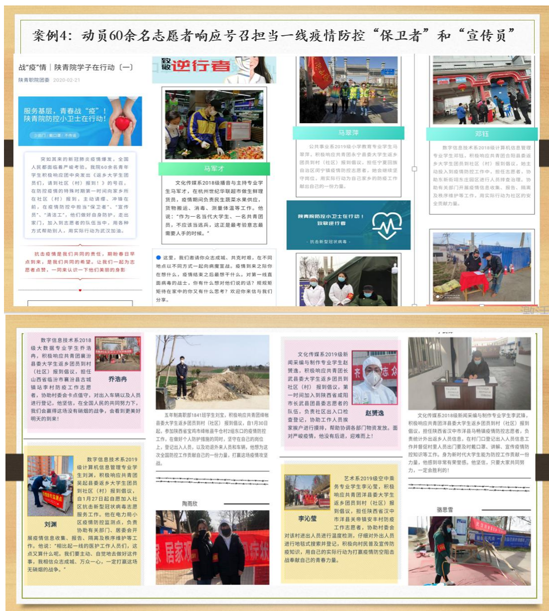
图4.1 学院60余名志愿者担当一线疫情防控“保卫者”和“宣传员”