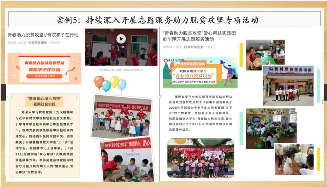
图4.3 学院持续开展志愿帮扶活动助力脱贫攻坚

围绕留守儿童的学习、生活和心理健康等方面与村里的孩子们开展了少儿美术手工，舞蹈音乐，游戏互动等交流活动，现场指导小朋友制作了诗歌挂画、手绘折扇、学跳《种太阳》、《宝贝宝贝》等儿歌，开展团队体能游戏，贫困孩子家庭走访慰问，向孩子们赠送“七彩假期”学习礼包，鼓励孩子们爱学习、讲卫生、懂礼貌。五天里，志愿者们在村委会与驻村扶贫队员同吃同住，深受教育，感慨万分。大家纷纷表示要继续发弘"奉献、友爱、互助、进步"的志愿服务精神，与孩子们一起勤勉互助学习，练就过硬本领，用自己的善行向社会传递出无私大爱的正能量。