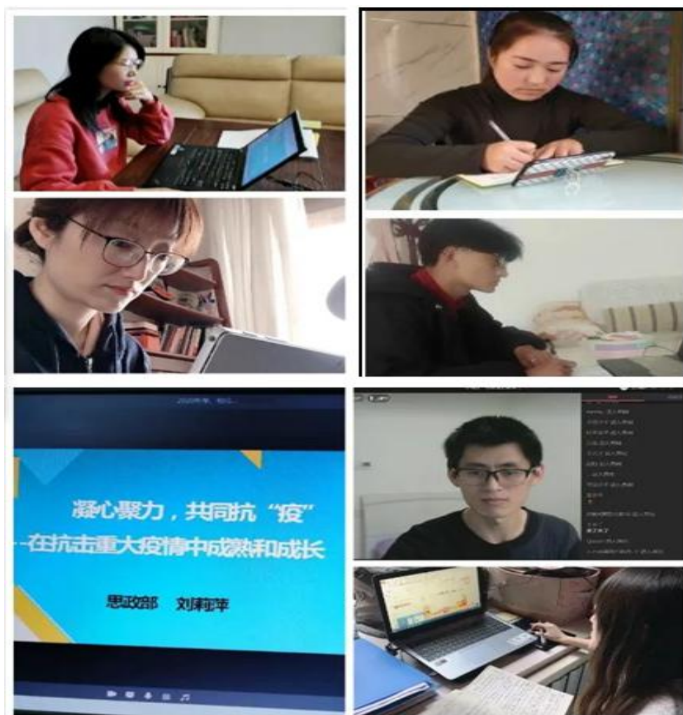
图 3.10 师生线上授课现场