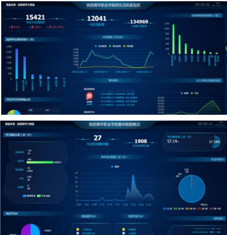
图 3.9 线上教学平台实时监控数据

延期，但云端开课如约而至。平时严肃老师们瞬间爆发，纷纷使出“十八般武艺”，化身青院“一线主播”，为同学们带来生动、富有活力的开学第一课。为了提高授课质量，除了充分发挥在线课程平台功能外，老师们还利用早已准备好的QQ群、微信群等和学生开展线上互动，下发任务、开展讨论、布置作业，提高学习效率。同学们也克服各种困难，各种工具平台齐上阵，共同参与，成就了一次难忘的“求学”经历。开课第一天，教务处、学生处、质量管理中心、各系(部)协同联动，共同搭建师生沟通的线上桥梁，多渠道监控上课情况，全力保障线上教学。