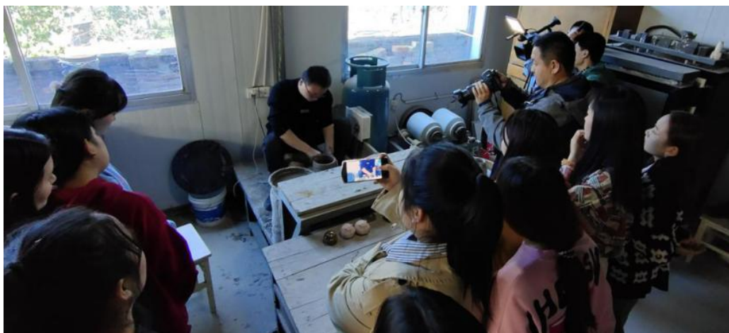
图 3.4 师生观摩非遗传承人拉坯技巧