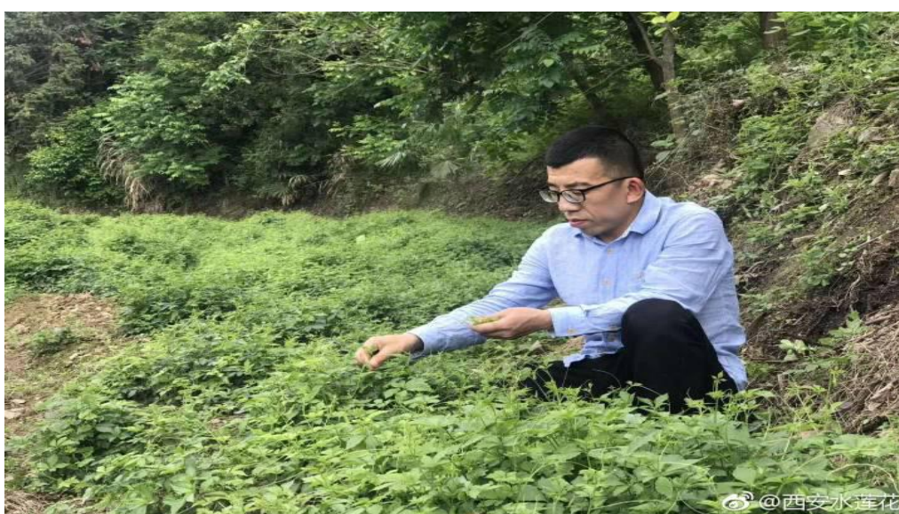
图 4.1 学院助力电商创业，把陕西优质农产品推向全国