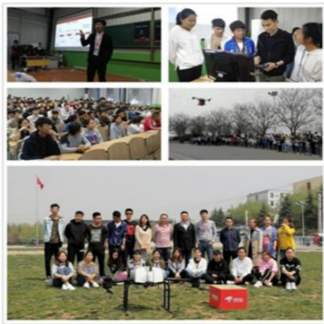
图 3.5 “京东无人机”物流配送创新创业公开课走进学院