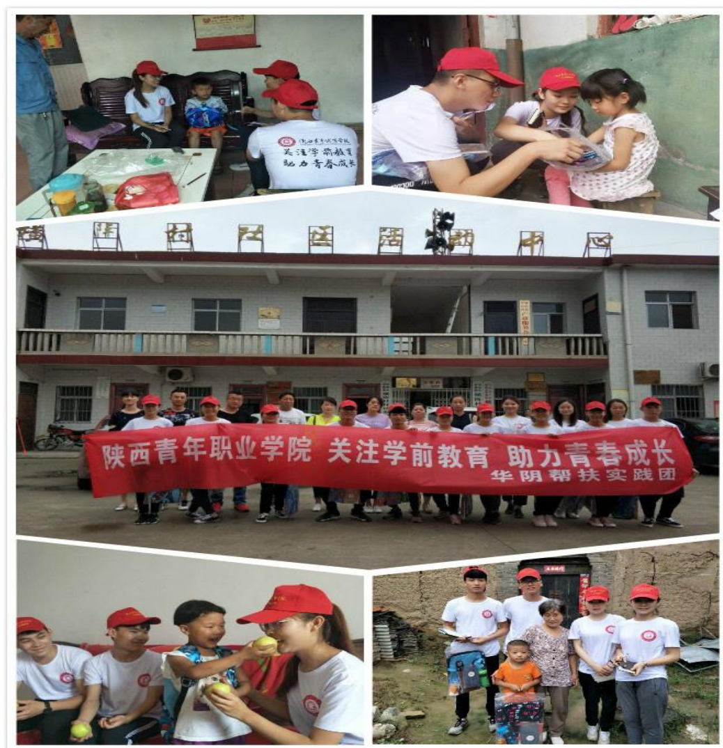
图 4.2 “青春助力脱贫攻坚”暑期专项志愿服务支教活动

得到村两委和村民的热情赞颂和肯定，而且对于学生志愿者是一场无声的爱的教育，志愿者们表示要认真学习专业知识，提高专业技能，以后有机会多参与此类社会实践活动，贡献自己的力量，做一个有爱心、有奉献精神，积极传播正能量的新一代大学生。