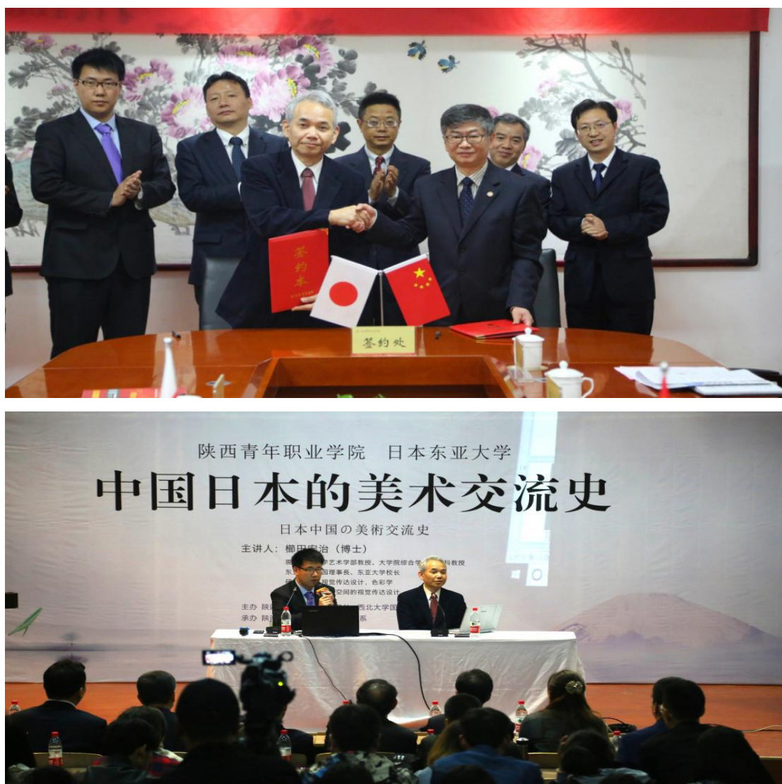
图 5.1 日本东亚大学校长栉田宏治一行来院访问交流

访问交流。在灞桥校区召开座谈会，讨论了两校未来的合作框架，即从学生留学、短期交流开始，逐步拓展到教师及科研方面的合作交流，并签署了交流与合作协议书。栉田宏治参观了学院衍纸工作室和画室，并为文化传媒系师生作了题为《中国日本美术交流史》的演讲，阐述了从古至今中日两国在美术方面的交流与影响，分享了当代日本艺术设计方面的知识，为学院与日本东亚大学搭建了互相交流学习的桥梁全方位合作奠定了基础。