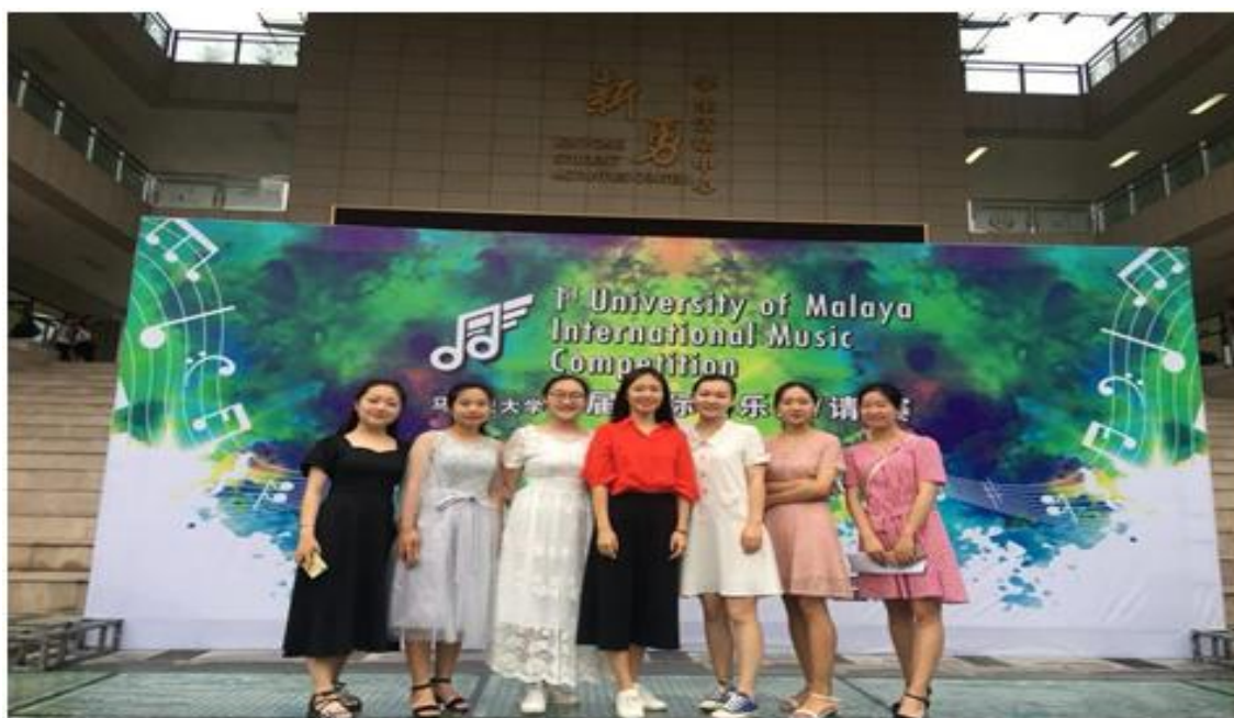
图 5.2 公共事业系学生在国际钢琴大赛中喜获大奖

公共事业系学前教育专业学生在指导教师的带领下赴新勇学生活动中心参加马来亚大学和陕西师范大学联合主办的 2018 年首届国际器乐邀请赛陕西赛区选拔赛。本次大赛设立钢琴、民乐、合奏三个比赛项目，参赛的六名学生经过激烈的角逐，最终获钢琴合奏组一等奖 1 项、钢琴独奏公开组一、二、三等奖各 1 项，优秀教师指导奖 1 项。