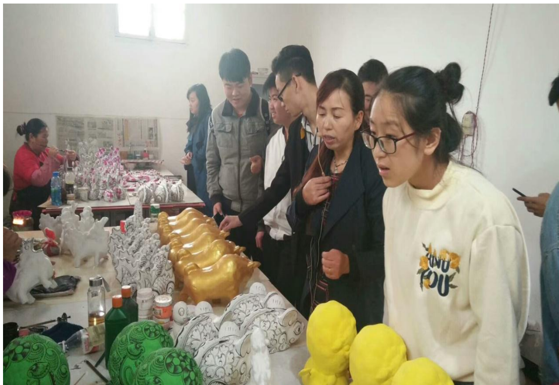
图 3.1 文化传媒系立足陕西民间艺术拓展专业特色