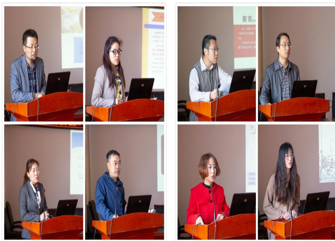
图 2.1 学院召开 2018 年学生思想政治教育调研交流会