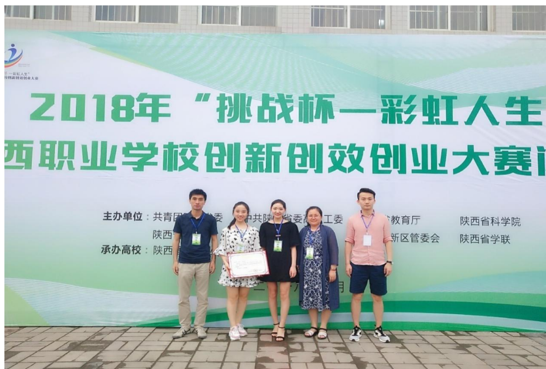
图 3.4 艺术系学生获“挑战杯—彩虹人生”创新创效创业大赛银奖