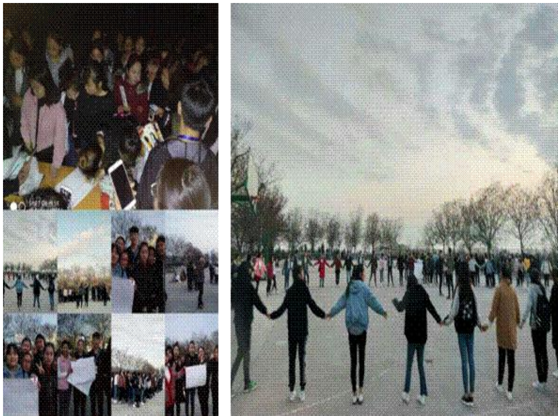
图 2.3 学院启动“善爱自己，追逐梦想”阳光护航心理健康活动