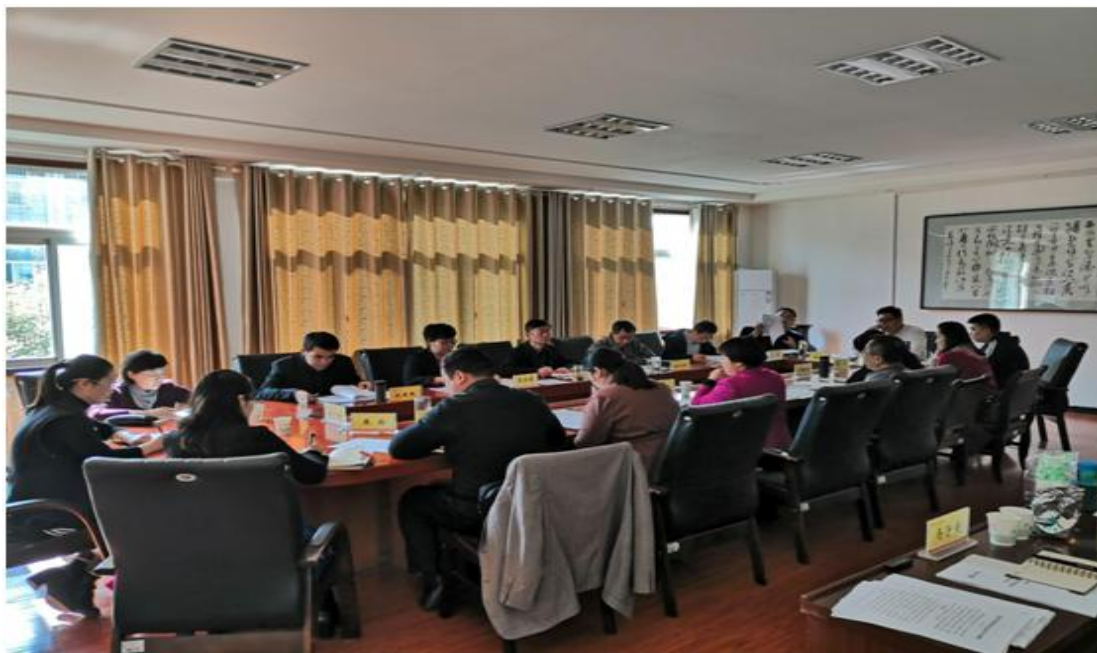
图 6.1 学院召开 2018 年度诊改工作推进会