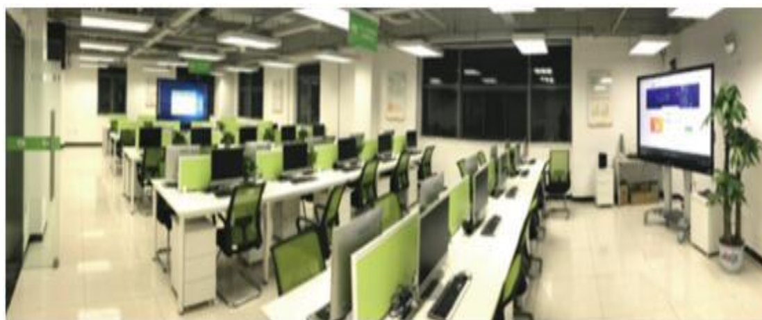
图 3.3 财经系与校企合作企业共建校外共享实训中心

程体系改造、课程建设、教材建设、实训室建设等都有了全新的合作样本。学生不仅实现了在 500 强企业就业的目标，也使得专业发展、合作模式走在前列。