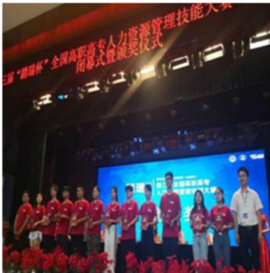
图 3.2 管理系学生获第三届“踏瑞杯”全国高职高专人力资源管理技能大赛一等奖