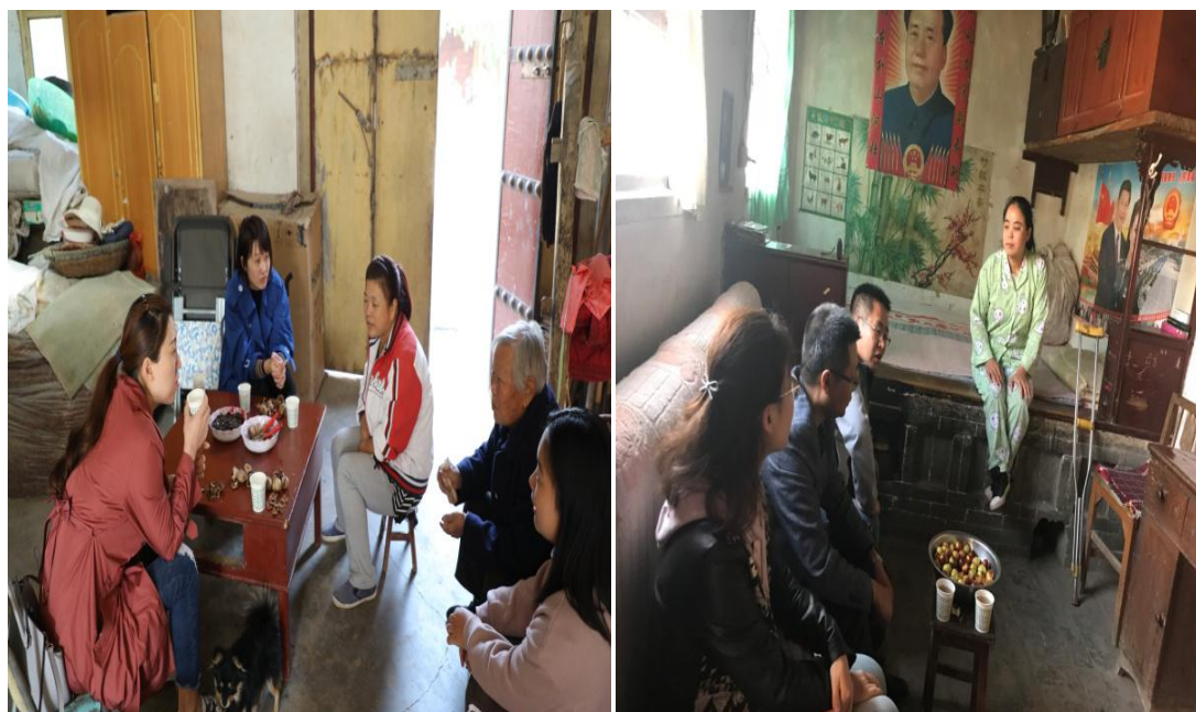
图 2.4 走访建档立卡户家庭

心，提升就业竞争力，做细做实就业帮扶措施，切实保障了每一名建档立卡户家庭学生安心就学、顺利完成学业，实现全部就业，兑现了承诺，体现了责任。